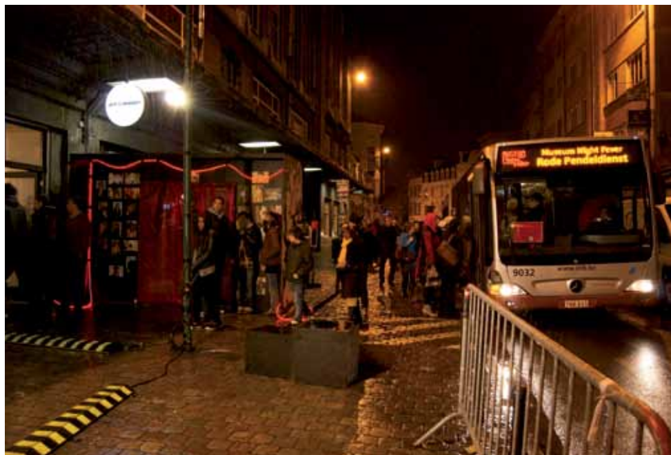
Expositions et performances par les jeunes de « XL'J » lors de la Museum Night Fever 2011.

Tous ces projets montrent à quel point le projet « MJ » a du sens ! À travers différentes disciplines socioculturelles et artistiques, les jeunes s'expriment, échangent, partagent, expérimentent, ... en vue de développer leur sens critique et leur autonomie. Les exemples de projets montrent également que les MJ développent de nombreux partenariats avec les associations locales et génèrent ainsi des rencontres intergénérationnelles et interculturelles riches et porteuses de sens !